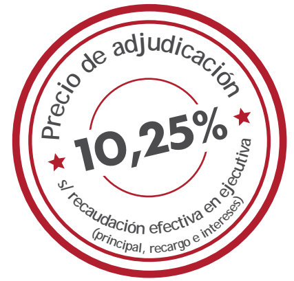
Ejemplo de Cuadro de Mando de Gestión de Ejecutiva